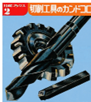
切削工具のカンドコロ 技能ボックス (2) 技能士の友編集部 大河出版